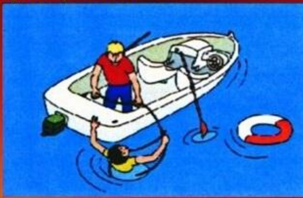
Используйте для спасения любые подручные средства

Существуют различные способы оказания помощи утопающему, но ни один из них не является универсальным.