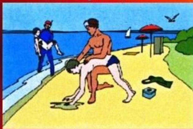
Доставив пострадавшего на берег, очистите ему полость рта и удалите воду из дыхательных путей, легких и желудка.