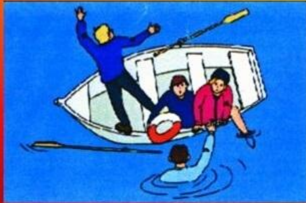
Поднимайте тонущего из воды только с кормы лодки