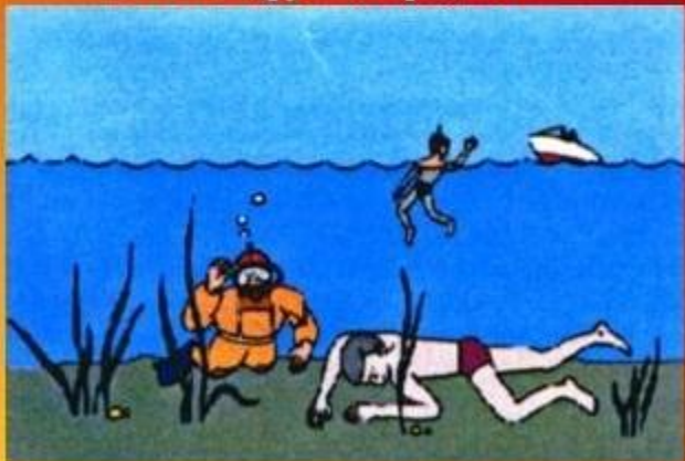
Не оставляйте попыток достать со дна утопущего в течение не менее 10 мин.