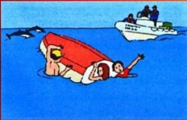
Не отплывайте от перевернувшейся лодки, толкайте ее к берегу или ждите помощи